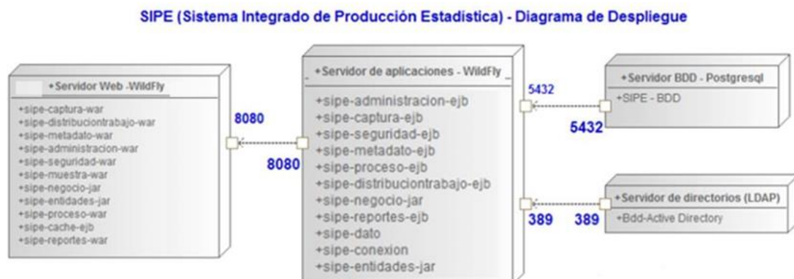
Figura 4 A6: Diagrama de despliegue (Sistema Integrado de Producción Estadística)